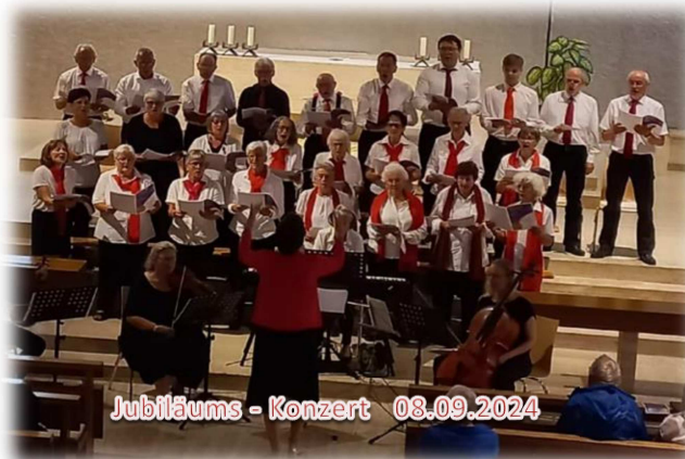
Jubiläums - Konzert 08.09.2024